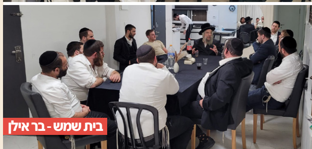
בית שמש - בראיל