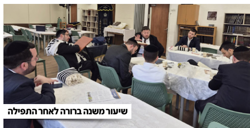
שיעור משנה ברורה לאחר התפילה

לאחר תקופה נוספת של צמיחה והתפתחות, התחלפה הנחלת התל, ונדרשנו לחפש מקום חדש לתפילות. התאספנו החברים כולם, לדיונים ארוכים בדבר עתיד הקהילה, והכיוון אליו אנחנו רוצים להתפתח. קיבלנו החלטה שאנחנו לוקחים הלוואות ככל שידרש, ועושים כל מאמץ כדי להקים בית כנסת שיהיה הבית של הקהילה. העקשן יצליח, מסיים אבי. עברנו כאן כל כך הרבה מכשולים ומורכבויות, חברים שעברו דירה ועזבו, קשיי לוגיסטיקה ובעיות כספיות. בסופו של דבר, המסירות של החברים כולם, כמו שהיא באה לידי ביטוי אפילו בהקמת המכנה שלנו כרגע, בה לקחו חמישה חברים שהם קבלני בנייה, לצד חברים אחרים שתרמו כולם מכישוריהם ויכולותיהם למען הקהילה. בסוף הדברים מסתדרים, והאווירה הטובה, ההשקעה והמסירות הביאו אותנו למקום טוב של קהילה לתפארת, בני תורה נהדרים שרק רוצים לגדול ולהתפתח יחד, לעבדך באמת ובלב שלם.