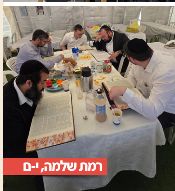
רמת שלמה, ו-ם