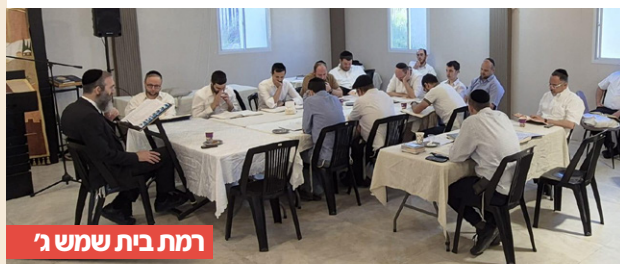
רמת בית שמש ג'

באיוור קל, הגיעו אל שולחן המערכת, תמונות מאירועי בר בי רב דוד יומא, שהתקיימו בקהילות חלקי, בתאריך ה' באייר, כאשר בני התורה ניצלו את היום החופשי בעבודה, לעסוק בתורה יחדיו, ולהעמיק את ידיעותיהם בשלל נושאים, ברוח המקום והשעה: